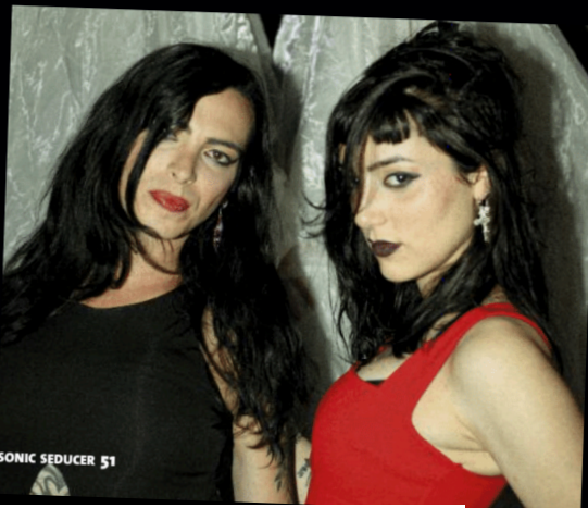
SONIC SEDUCER 51