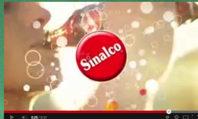
„Like this“ im internationalen Kinospot von Sinalco