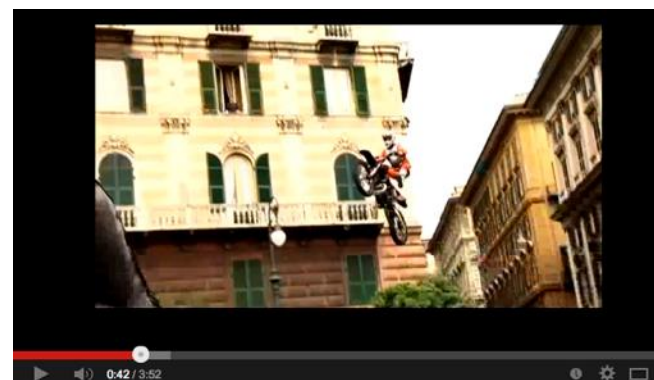
„Fly with me“ im Clip Daboot Fmx Show