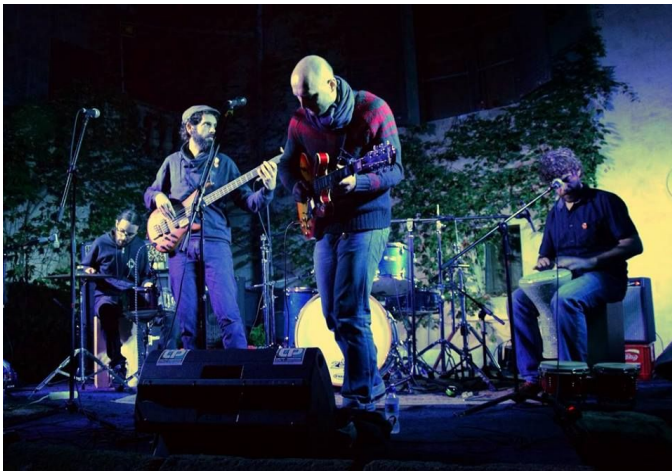
Configuración 2+2 (batería y percusión invertidas)