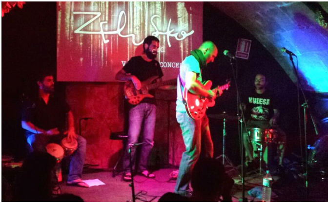
Configuración 1 + 3