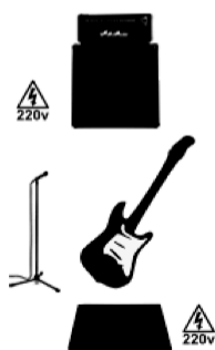
Manel Gris (guitarra elèctrica)