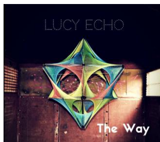
The Way - EP (2016)