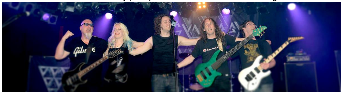
Reaching third place in a band battle at Twentietoe - Tiel

Verwacht veel meer de komende tijd, laat je verrassen in hun enthousiaste originele live shows!