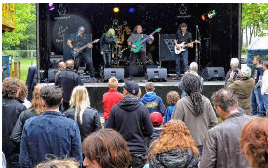
Rain defying audience at the Kerspop festival 2014.