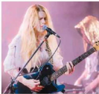
Artists performing on stage at the Festival France Laos.

The festival will close on Sunday with a special fashion show organized by the Lao Fashion Week and the French design school ESMOD.