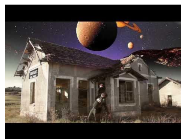
“Nights In Saturn”