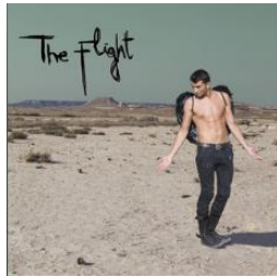
The Flight (2010)