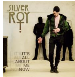
It's All About Me (2015)